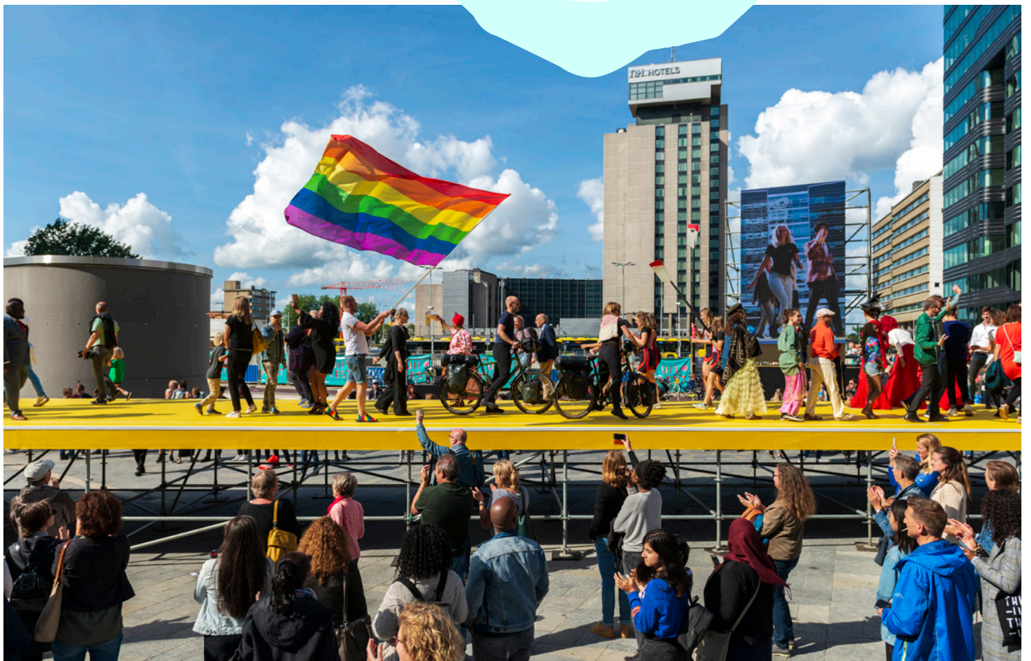
What Is the City but the People? , een levend zelfportret van de stad Utrecht naar een idee van kunstenaar Jeremy Deller, op het Jaarbeursplein 2018. BAK, basis voor actuele kunst, Utrecht in samenwerking met Centraal Museum Utrecht en SPRING Performing Arts Festival.