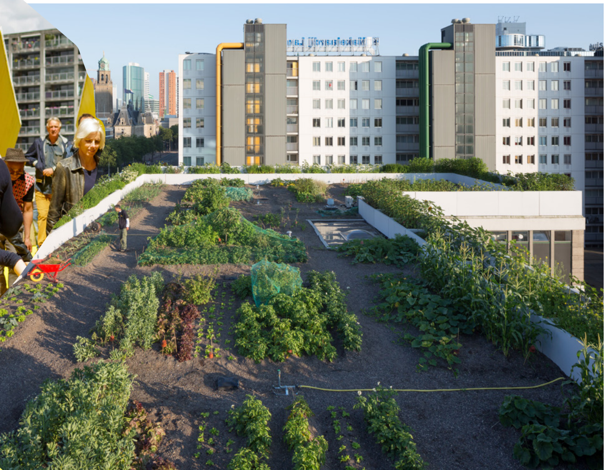
De Luchtsingel (2011) verbindt Rotterdam-noord met het centrum. Dit initiatief van ZUS brengt nieuw leven in een vergeten gebied met een loopbrug van 400 meter, een dakakker, een evenemententerrein op de Hofbogen en een park.