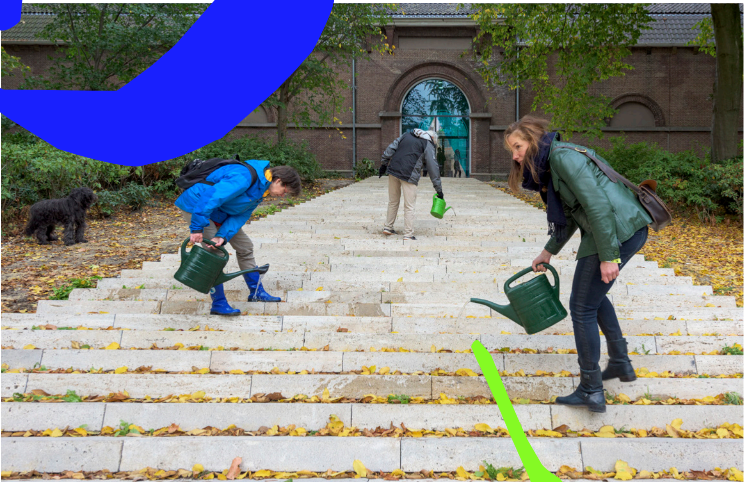
De Vanishing Staircase (2018), ontworpen door Birthe Leemijer in opdracht van gemeente Utrecht, is een ecologisch kunstwerk in het Utrechtse Zocherpark. Het werk symboliseert het besef dat mensen, dieren en planten naast elkaar leven, in tegenstelling tot de hiërarchie waarbij mensen het belangrijkste zijn, gevolgd door de dieren en daarna de planten.