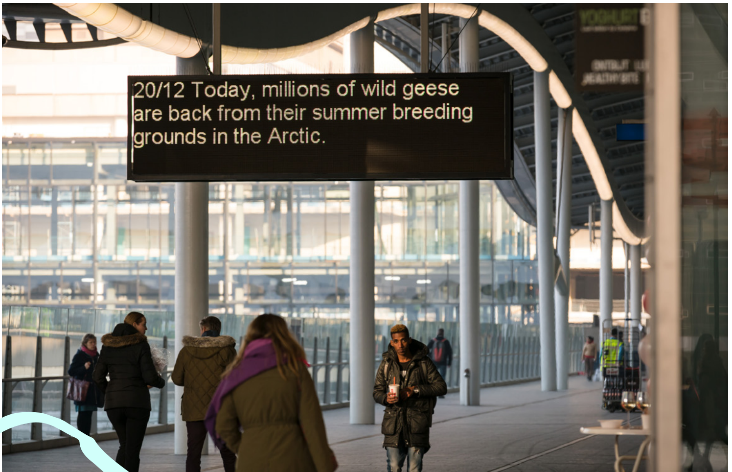
Arrivals/Departures (2016) Marcus Coates. Centraal Station Utrecht. In opdracht van gemeente Utrecht en Stichting Kunst in het Stationsgebied voor de manifestatie Public Works.