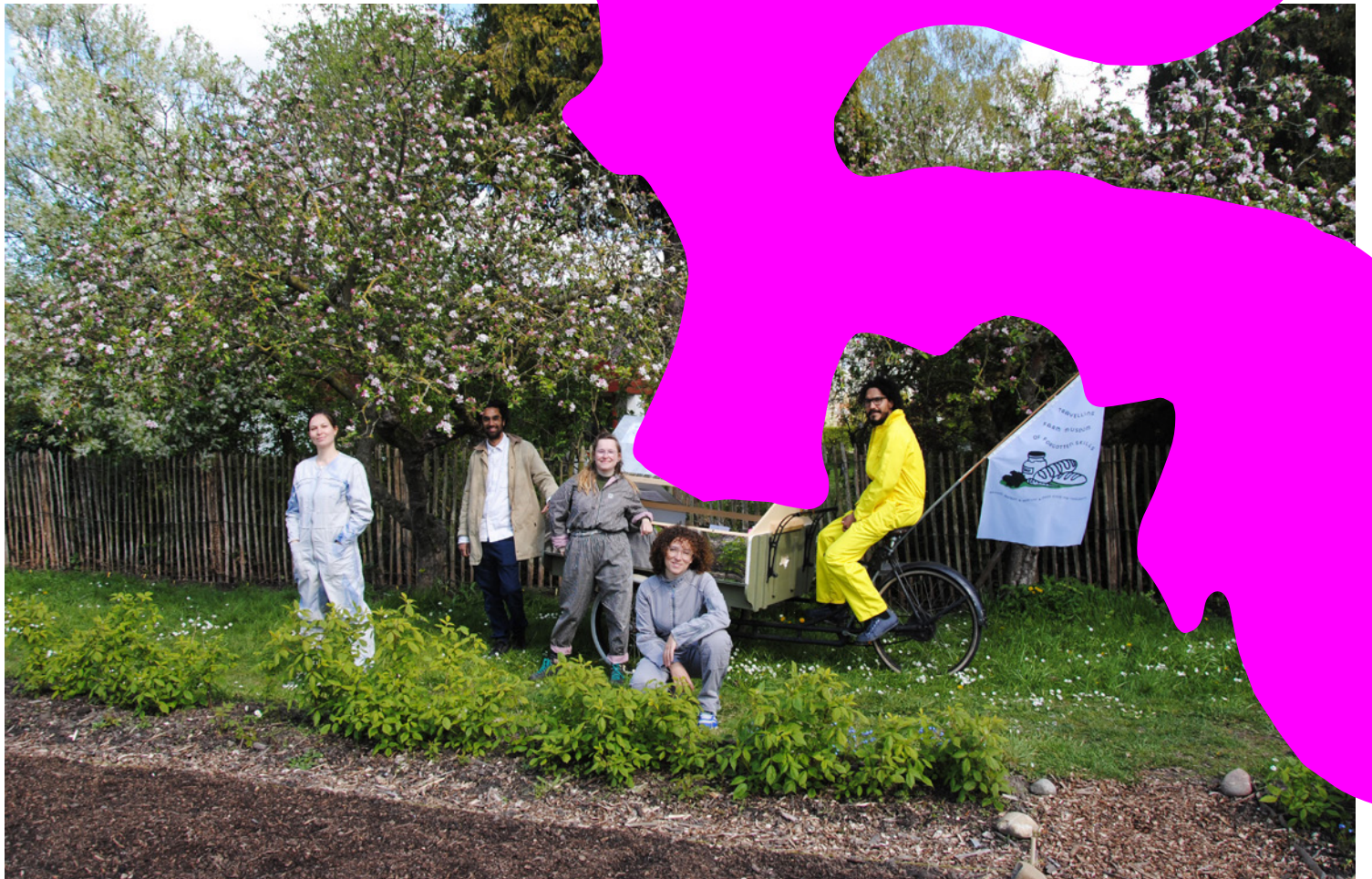
The Travelling Farm Museum of Forgotten Skills. Een participatief mobiel museum dat agrarisch erfgoed in Leidsche Rijn verkent om kennis en vaardigheden te cultiveren voor ecologisch, veerkrachtig samenleven. Een podcast serie brengt verschillende stemmen samen van boeren, kunstenaars, bewoners en dieren om na te denken over ons lokale voedselsysteem en cultuur. Een initiatief van Casco Art Institute: Working for the Commons en kunstenaarscollectief The Outsiders.