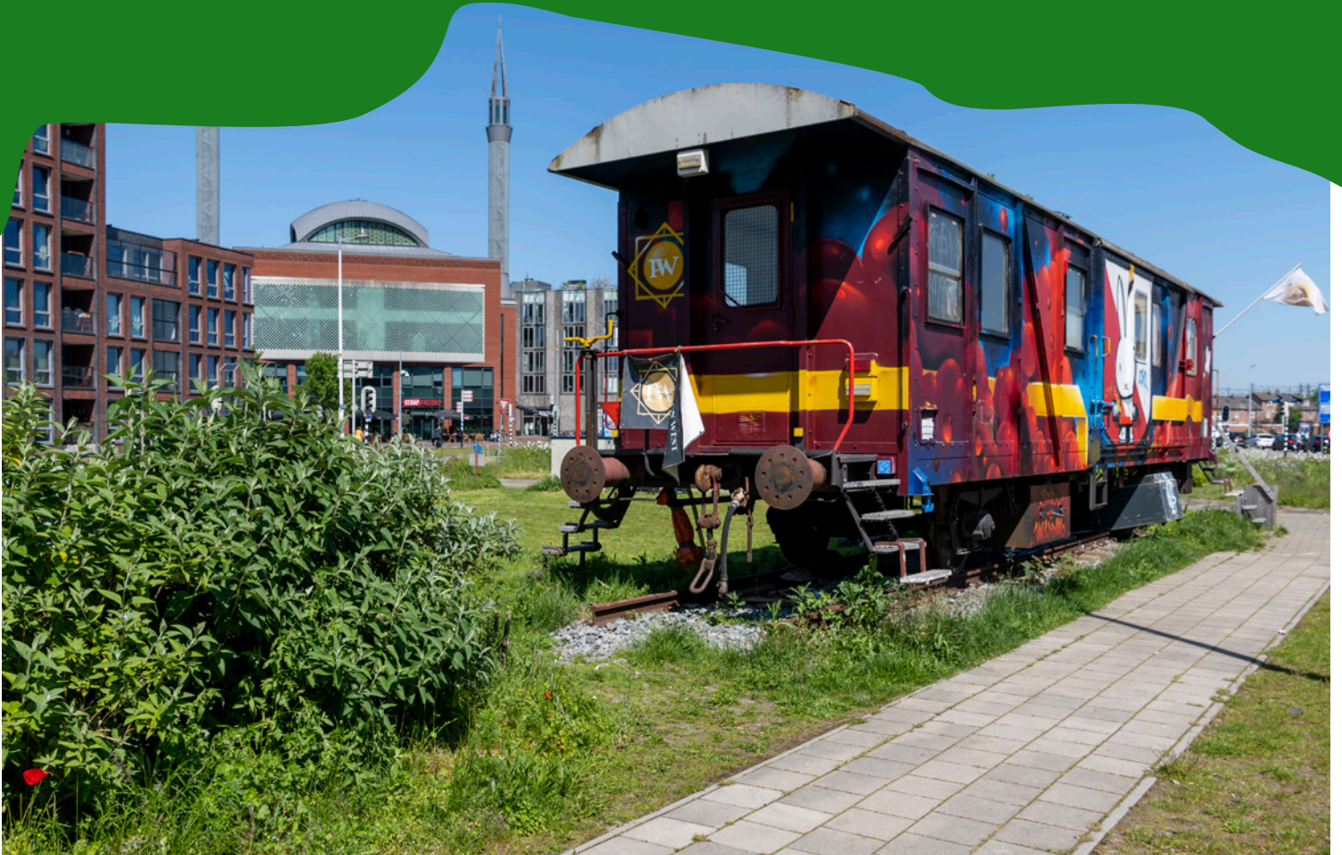
Perron West en Creative Playground op het Westplein/Lombokplein.