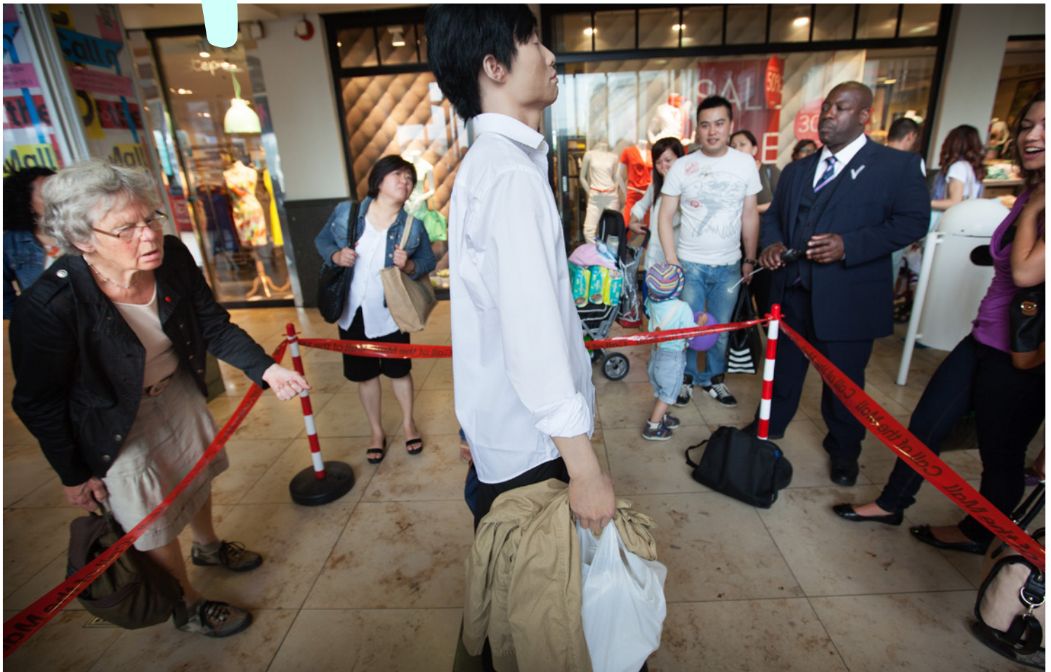
Tank Man (2013) Fernando Sánchez Castillo. Hoog Catharijne. In opdracht van gemeente Utrecht en Stichting Kunst in het Stationsgebied voor de manifestatie Call of the Mall.