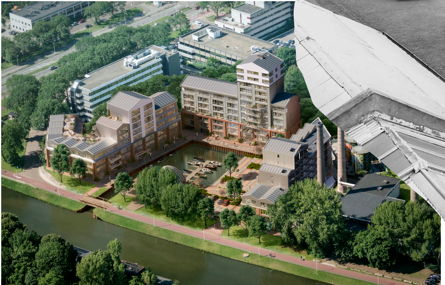
In de afgelopen eeuw hebben functies als tuinbouw, industrie en bewoning hun sporen nagelaten in de Merwedekanaalzone. 1700-1900: hoveniers zijn de voedselleveranciers voor de stad; 1900: dé plek voor industrie; 1900-1950: grote bedrijven met veel werknemers; 2020: de nieuwe wijk aan het kanaal.