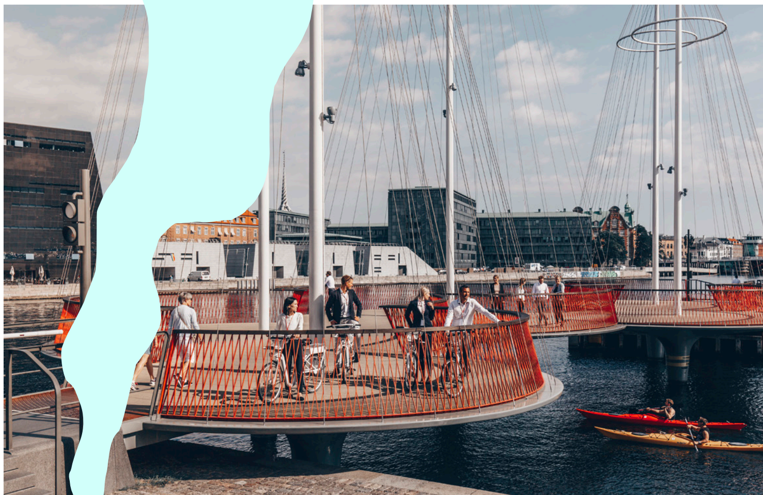
Cirkelbroen (2015), een loop- en fietsbrug in Kopenhagen ontworpen door kunstenaar Olafur Eliasson. Het ontwerp met 5 masten verwijst naar het scheepvaart verleden van de stad en het cirkelvormige parcours nodigt fietsers en wandelaars uit om hun snelheid te minderen en van het uitzicht te genieten.