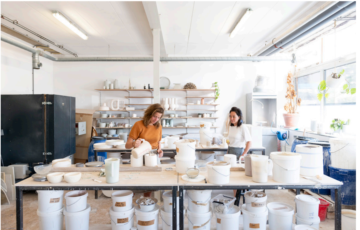
Broedplaats Vechtclub XL, gevestigd op het voormalige OPG-complex in de nieuwe wijk Merwede.