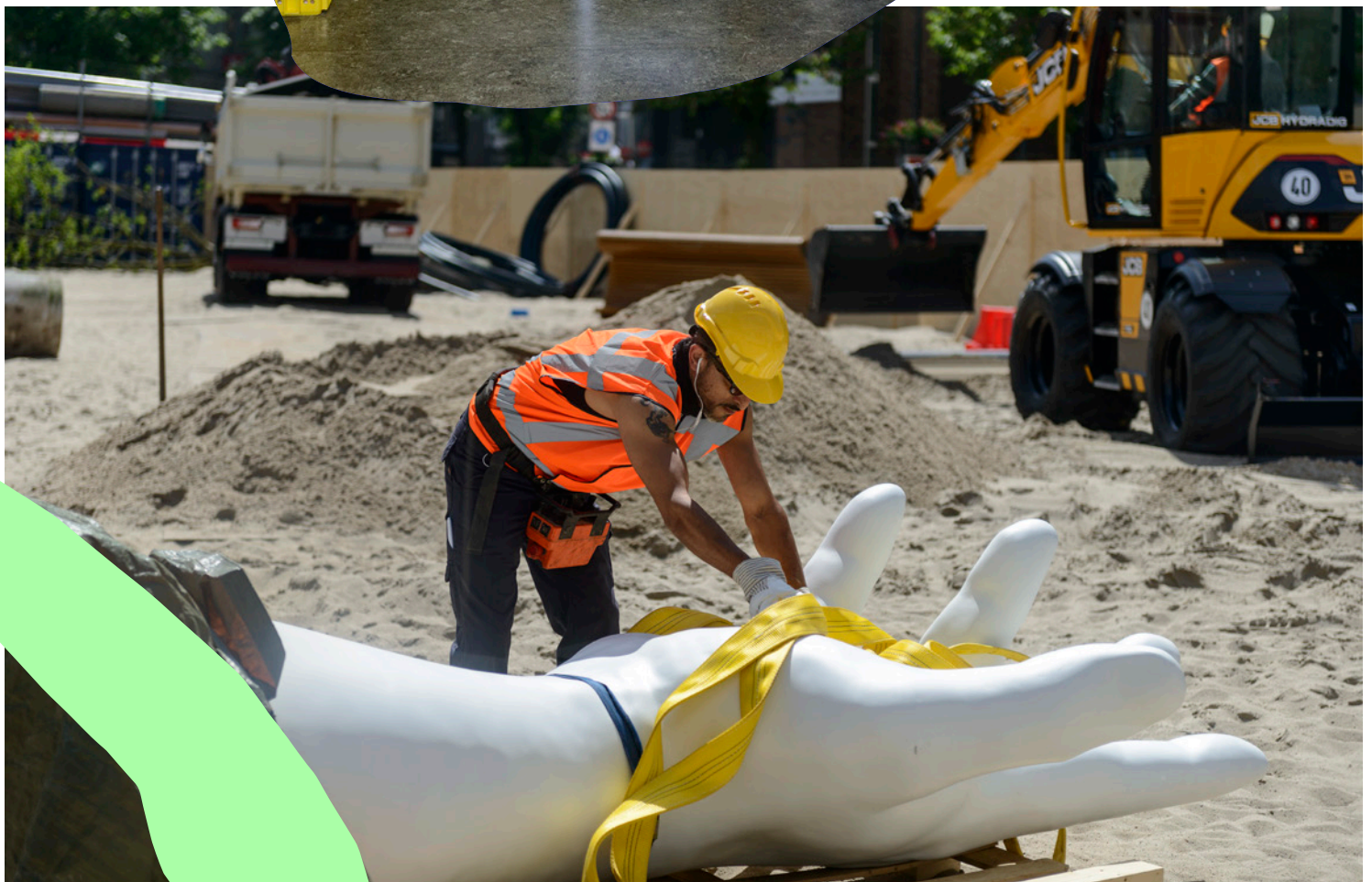
Sic transit gloria mundi , Dries Verhoeven, op de Neude 2018, in co-productie met SPRING Performing Arts Festival. Een bouwplaats in het centrum van de stad fungeert als model voor een wereld in transitie, waar ideeën over macht en zeggenschap beginnen te verschuiven.