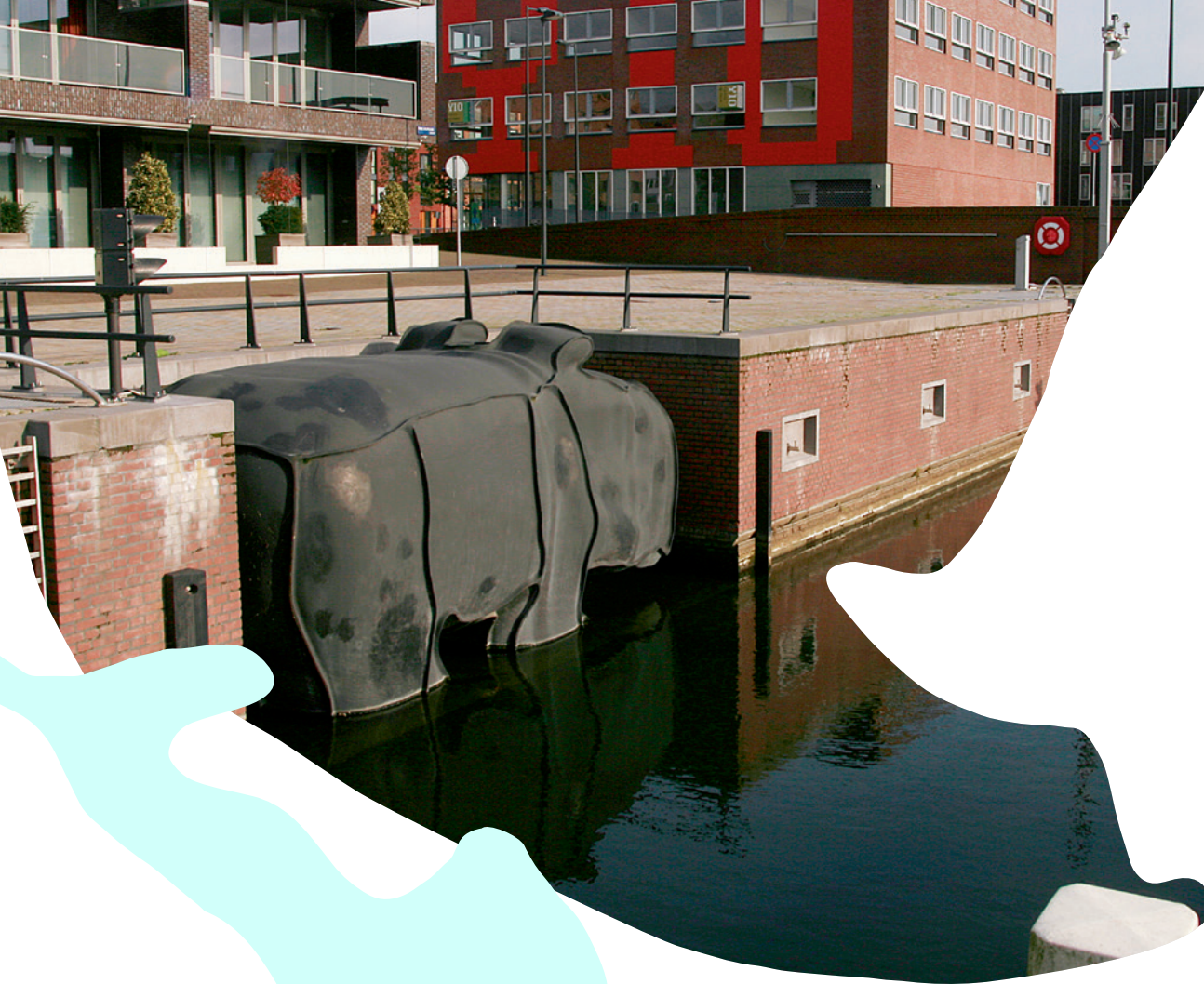
Hippo (2008) Tom Claassen, IJburg Amsterdam, foto: Tom Claassen